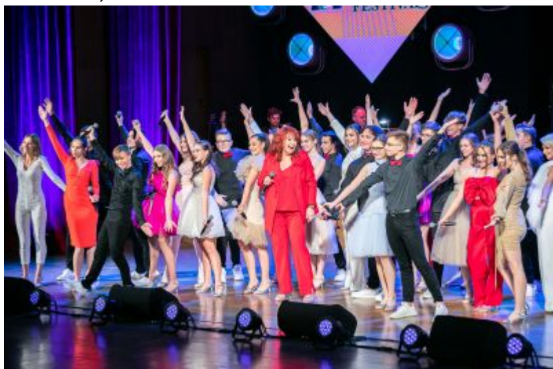
Grupa Artystyczna CSW